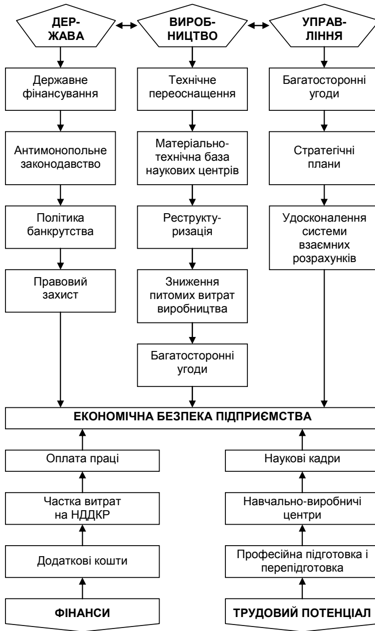
Схема взаємодії показників, які впливають на рівень економічної безпеки підприємства